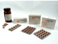
Bild: Vom ersten Apothekerglas zur modernen Blister- verpackung. Eine Zeitreise durch 30 Jahre PADMA 28 in der Schweiz. Und immer noch heisst es: „Lesen Sie die Packungsbeilage...“.

Die Kräuterrezeptur wird nach wie vor in der Schweiz hergestellt (nach international anerkannten Qualitätsstandards) und in 12 Länder exportiert. Wissenschaftler aus Europa, Israel und Amerika haben sich mit PADMA 28 auseinandergesetzt. Gemäss neuesten Erkenntnissen greift die Rezeptur in verschiedene Stoffwechselfvorgänge im Körper gleichzeitig ein.